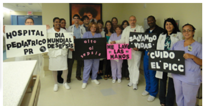
Eventos del WSD en Berlin, Vilnius y San Juan.