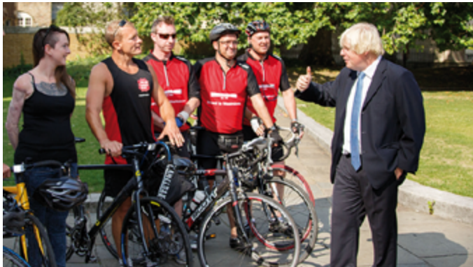
Evento de ciclistas organizado por el UK Sepsis Trust, 2013.